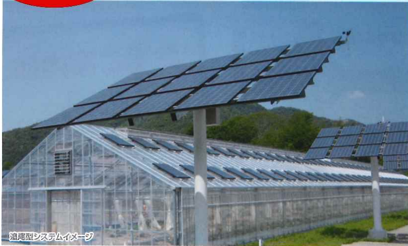
追尾型システムイメージ