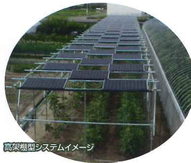
高架棚型システムイメージ