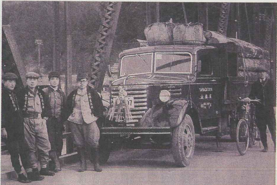
1953年ごろ。当時まだ郡上に2台しかなかったという最新型トラックで初荷を運ぶ

の基本。住を生活全体を網羅する生活産業としてとらえ、その枠組みから逸脱しないように事業を展開していく(吉田隆彦会長)と軸足はぶれない。 創業の地は現在の岐阜県山県市。1918(大正7)年に初代・吉田重兵衛がヤマガタヤの前身「山県屋材木店」を創業したのが始まり。良材を求めて山ごと購入。伐採、搬出して名古屋など消費地へ運び販売